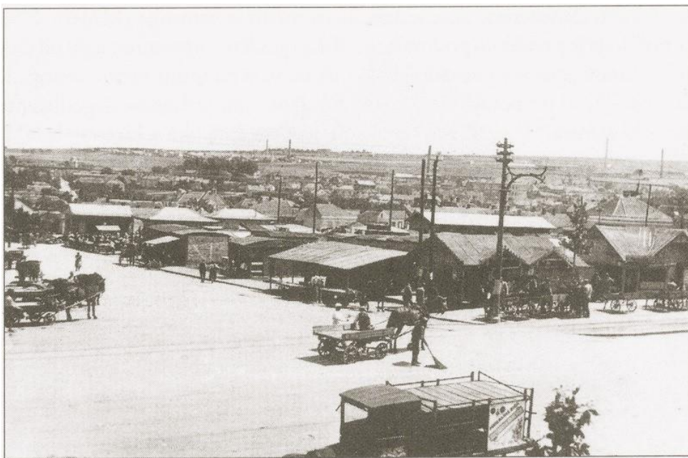
Слика 19. Пијаца „Ђерам“ тридесетих.

Трамвајска линија је од 1912. године повезивала Ђерам са центром града, што је уз кафане које су ницале крај пута оживело овај део Смедервског друма. Ђерам се граничио са Булбулдером и Славујевим венцем на северу, Лионом и Липовим ладом на истоку, Вуковим спомеником на западу и Црвеним крстом на југу. Након Првог светског рата у овај крај доселили су се руски емигранти, занатлије, службеници у пензији. Куће су грађене од слабог материјала, а уз Смедеревски друм ницале су радње. Изграђена је фабрика обуће Бостон (недавно продавница Нови дом ), а свако вече одржаван је корзо. Општина Стари Ђерам настала је 1952, а 1957. године припојена је Звездари.