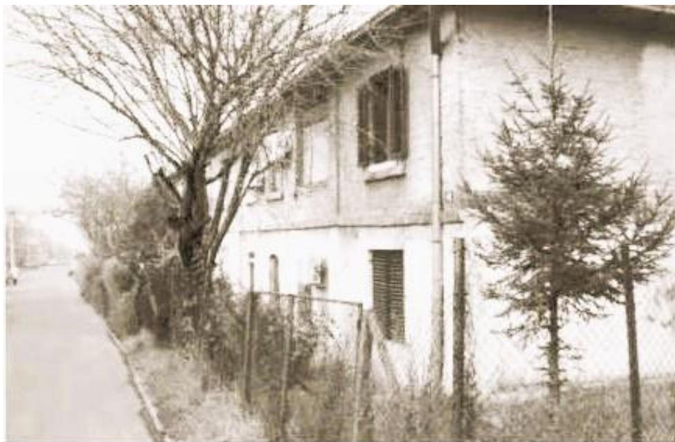
Слика 21. Зграда са радничким становима циглане „Милишић“ подигнута 1920. године. Поглед из Улице Светог Николе 2009. године 136 .

Знање постоји као нешто више од онога што изгледа као чисто позитивно знање...између је осталог...то је елаборација не само основне географске разлике...него и читавог низа „интереса“ које оно не само што ствара него и одржава уз помоћ средстава каква су научно откриће, филолошка реконструкција, психолошка анализа, опис пејзажа и социолошки опис.