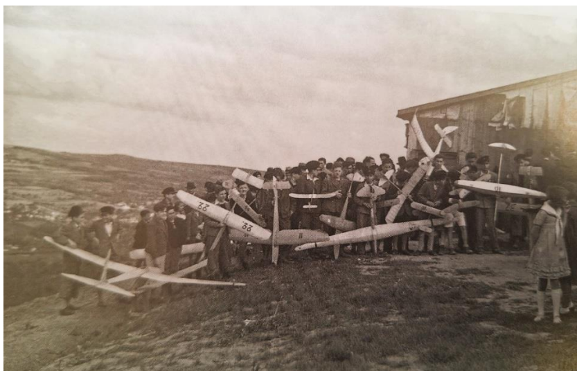
Слика 13. Такмичење моделара – једриличара код зграде Опсерваторије на Великом Врачару 3. маја 1936. године 98 .

Како је Опсерваторија била ван града било је потребно подићи трансформаторску станицу и довести воду. Техничкој дирекцији града Београда упућена је молба да се обезбеди земљиште на углу улица Војводе Пећанца и Тамишке (Вељка Дугошевића и Супилове) где је требало да се смести електрична пумпа и прихватни резервоар. Опсерваторија је такође допринела озелењавању Звездарске шуме, тражећи од надлежних установа већу количину садница. Парк Опсерваторије је после Другог светског рата проширен на десетак хектара. Поред Опсерваторије налази се Волгина улица. Тамо где се данас налази институт Михаило Пупин некад је била трошарина. Падина према Ћалијама и Дунаву код ресторана Бели багрем 1934. служила је за летове групе Девети , а касније је то место озваничено као летиште за безмоторне летилице. 96 Постоји податак да је краљ Петар Први Карађорђевић желео да на Великом Врачару, на месту данашње Опсерваторије, сазида резиденцијални комплекс, али га је војни врх од тога одговорио због неодговарајућих безбедносних услова. 97