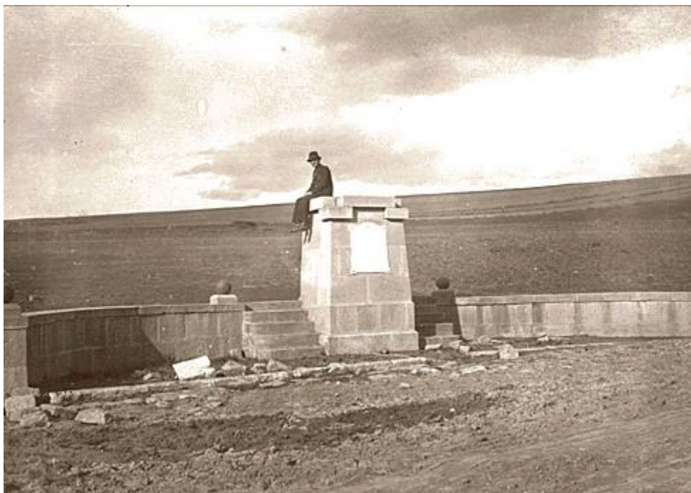
Слика 10. Трећепозивачка чесма у изградњи.

Преобликовање Београда почетком 20. века кренуло је комуналним радовима, калдрмисањем улица, изградњом новог водовода и канализације, увођењем електричног осветљења, укључивањем трамваја у саобраћај. Почетком двадесетих година набављане су керамичке цеви добијене у оквиру репарације из Немачке. Општина београдска тада је била у могућности да изгради једанаесту деоницу београдске канализације која обухвата леву падину Булбулдерског потока и цео слив између Крунске и Гробљанске улице. Из кредита градске власти почетком тридесетих над токовима сливова мокролушког и булбулдерског изведени су радови. Преко потока изграђени су булевари и улице као што је преко Булбулдерског потока прелазео Булбулдерски булевар, данашње улице Димитрија Туцовића и Цвијићева.