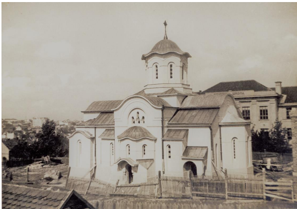
Слика 18. Црква Светог великомученика кнеза Лазара и школа „Цар Душан“ 124 .