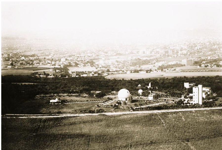
Слика 11. Поглед на Астрономску опсерваторију.