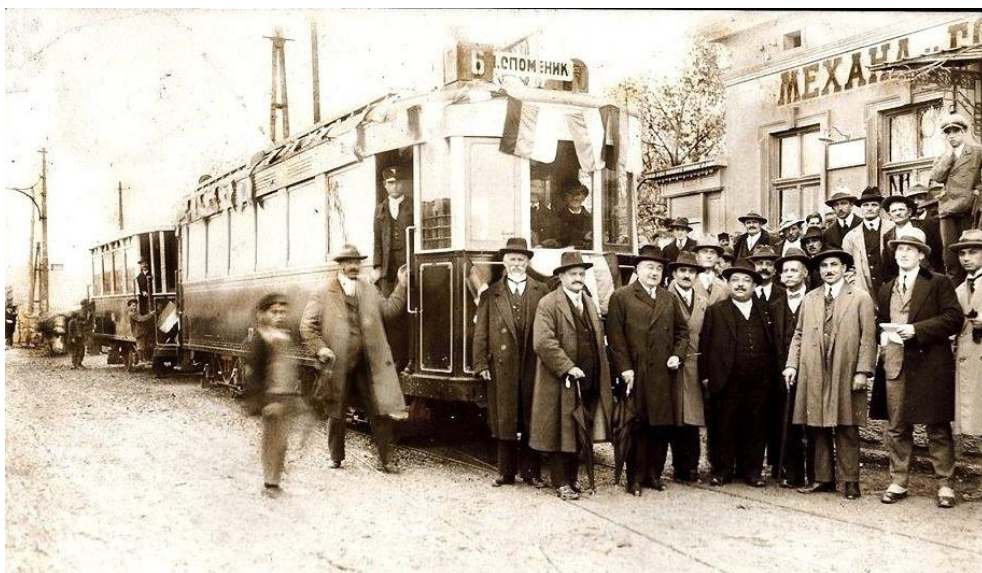
Слика 16. Трамвај број 6 код Цветка.

Читав крај око данашњег Вуковог споменика носио је име по кафани Каменовић (пре постављања споменика Вуку) која се налазила на раскрсници Александрове и Гробљанске, између Молерове и Голсвордијеве. У овом крају било је доста занатских и трговачких радњи, продавнице одеће и обуће држали су у главном Јевреји. Трамвај двојка скретао је у Гробљанску улицу код кафане Каменовић , данашњом трасом, а шестлица је продужавала Булеваром према пијаци Стари Ђерам до Цветкове кафане.