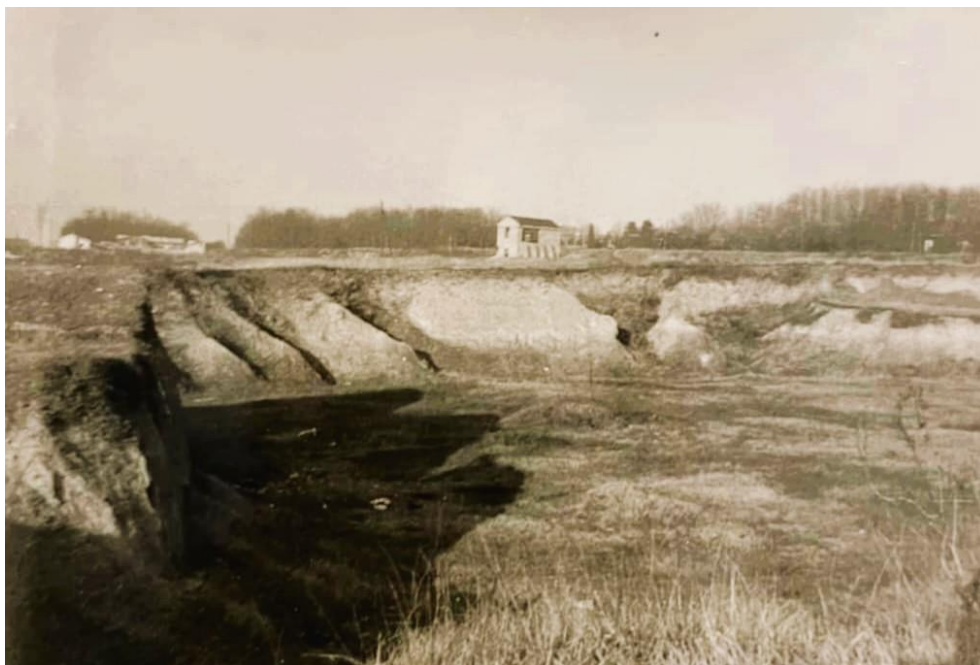
Слика 9. Циглана Вукишића, поглед из Улице Вељка Дугошевића