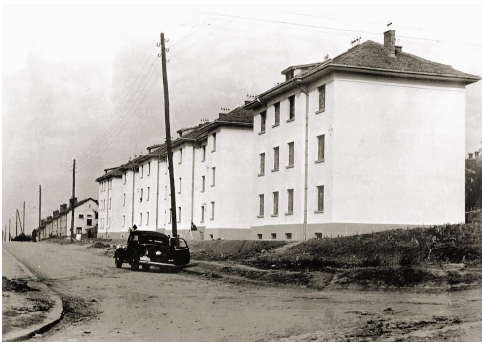
Слика 4. Павиљони на Северном булевару (угао са улицом Вељка Дугошевића) 1947. године 52 .

1941. године дограђена су три објекта 50 , као и вишеспратна зграда за смештај старих људи. 51 На великој пољани општинског имања иза плота Новог гробља у улици Северни булевар настало је ново насеље, Општинска колонија. Станови у општинској колонији били су намењени сиромашним чиновницима и породицама из Јатаган мале (која је рушена тридесетих година), међутим овде су се уселили само општински службеници.