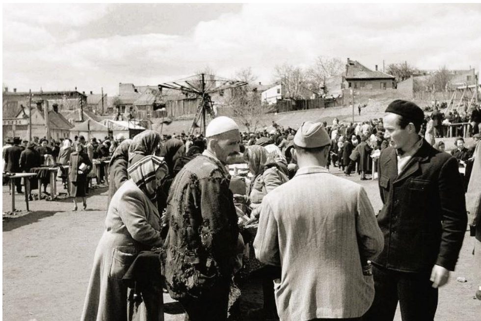
Слика 20. Цветкова пијаца иза „Цветкове кафане“.

се налазиле занатске радње, радње са прехранбеном робом, дрваре, апотеке, берберска и крзнарска радња, коларско-ковачка радионица, дуванџиница, млекара, браварска радионица, бакалница, четкарска занатска радионица. У крају код Цветкове механе било је почетака кожарске, металске и текстилне индустрије. Осамдесетих година овде су изграђене стамбене вишеспратнице које су заградиле улице које су раније излазиле на Булевар.