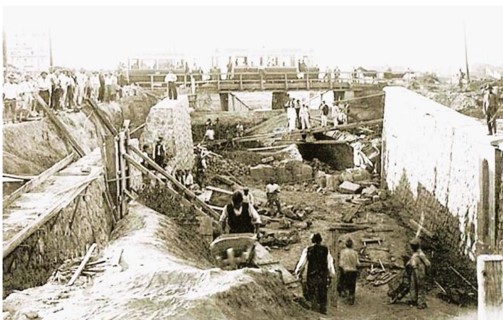
Слика 7. Изградња подвожњака 1931. – 1933. на раскрсници Димитрија Туцовића и Гробљанске 74 .