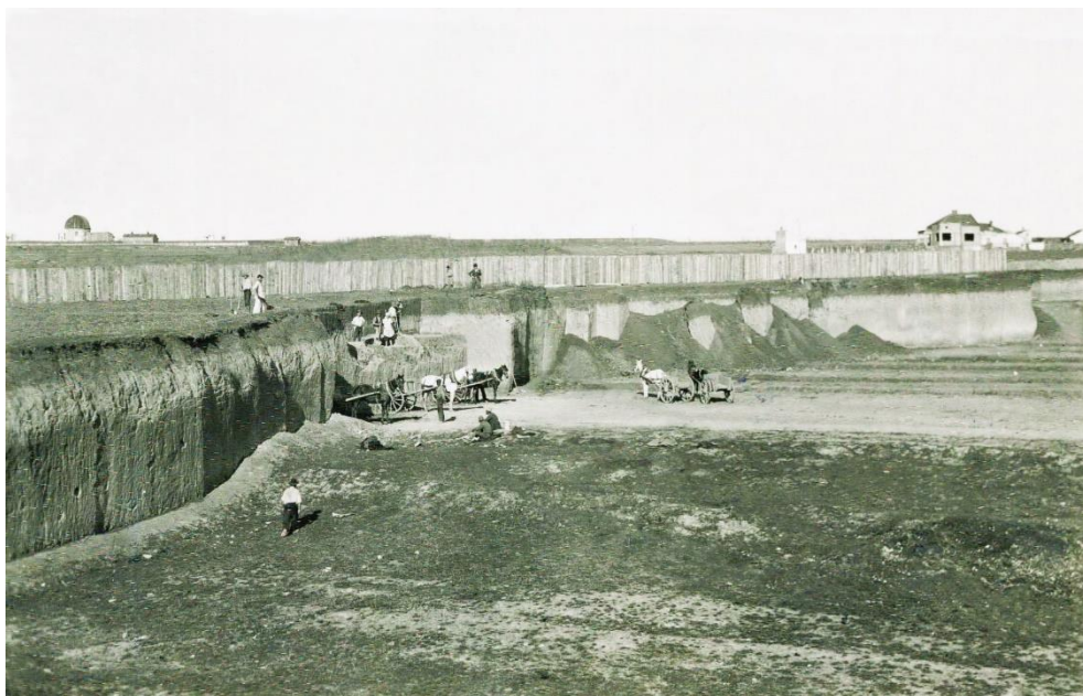
Слика 8. Копанье земље за потребе циглане на Великом Врачару 75 .

Велики системи циглана налазили су се на североисточном ободу града, између Вишњичког друма, Лаудоновог шанца и Новог гробља, затим дуж Миријевског и Смедеревског друма. Близу насеља биле су циглане са рингловима – озиданим пећима за печење цигле и великим озиданим базенима са водом. Крај од Булбулдера (Миличићева циглана код Градске болнице) до Лиона и Цветкове кафане (Јаћимовићева циглана на месту Вјекослава Ковача, Волгине и Дескашеве; Брунцликова циглана на простору Шесте гимназије, парка испред, Геодетске школе, Звездара театра ; Неимар , Слога ) био је познат по цигларској индустрији. Циглане које су заузимале велики простор снабдевале су цео град и велики део Србије.