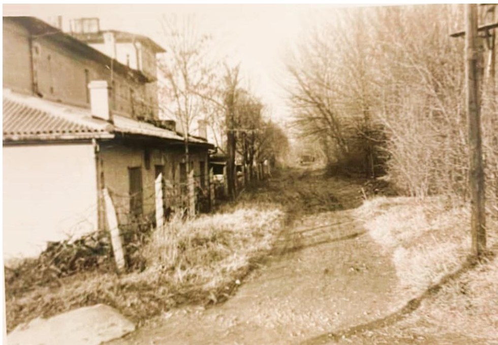
Слика 12. Улица Вељка Дугошевића код „Морава филма“.