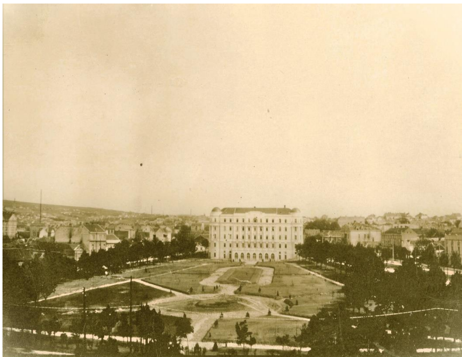
Слика 15. Парк код студентског дома „Краљ Александар Први Карађорђевић” 118 .