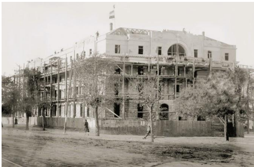
Слика 17. Изградња дома студената „Краљ Александар Први Карађорђевић“.

Некад су ту радили чистачи ципела са специјалним постољима за ногу, сандуцима са низом фиока и огледалима. 119 Поред њих били су продавци торбари (пореклом из Даламације) који су у правоугаоним кутијицама обешеним око врата продавали чешљеве, дугмад, игле, шнале и јефтине усне хармонике. Одмах преко пута налазио се, као и данас лепо уређен парк, а изнад њега је изграђен један од првих студентских домова у Београду, задужбина Александра Првог Карађорђевића који је проглашен за културно добро и споменик културе. Саграђен 1927–1928. године, за студенте Београдског Универзитета. 120 Архитектонски концепт прве куће за студенте сведочи о дару једног из групе руских архитеката који су у међуратно доба утицали на формирање Београда као европске метрополе. Пре Другог светског рата био је седиште (храм) Регуларне Велике ложе Југославије. Од 1946. до 2004. године, дом је носио име народног хероја Иве Лоле Рибара, а међу студентима је познат као Лола . Дом студената Краљ Александар Први Карађорђевић проглашен је културно добро и споменик културе.