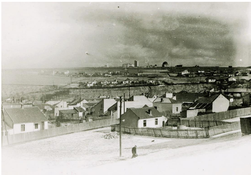
Слика 2. Поглед на Звездару из Пршевске улице код Градске болнице 1932. године.

ни закључавале. Пријатељски суседски односи уклонили су све физичке ограде, па се и тамо где нема пролаза стварао пут ка другом. 20 Слободно кретање поспешује друштвене односе, прихватање другог, за почетак вршњака и суседа па и околине. Кретањем се потенцира припадност свету и могућност да се свет сагледа.