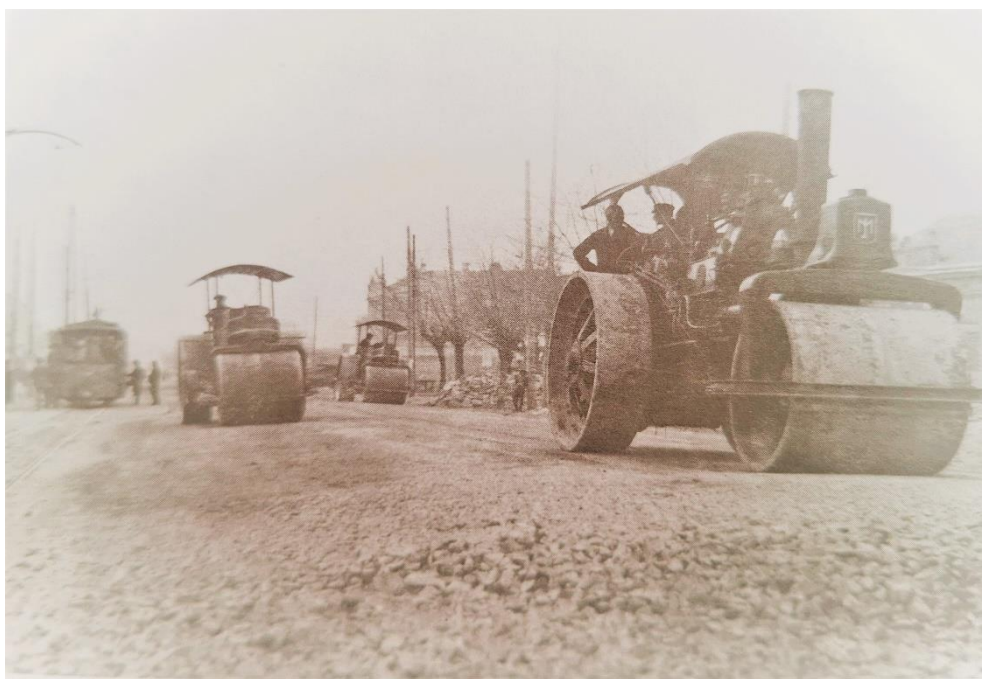
Слика 14. Радови на Улици краља Александра (код Ђерма) 1929/1930 117 .

Горња и доња чаршија Београда излазиле су на Цариградски друм. Цариградски друм од Стамбол капије до Батал џамије и Фишекцијске чаршије и пијаце Ђерам био урбанији део, одакле је улица попримала изглед неуређеног пута. Од пијаце Стари ђерам до Цветкове кафане, улица је била поплочана каменом коцком, са обе стране улице простирао се дубоки шанац преко кога су били постављени дрвени мостићи. Са обе стране улице били су посађени високи јабланови. 116